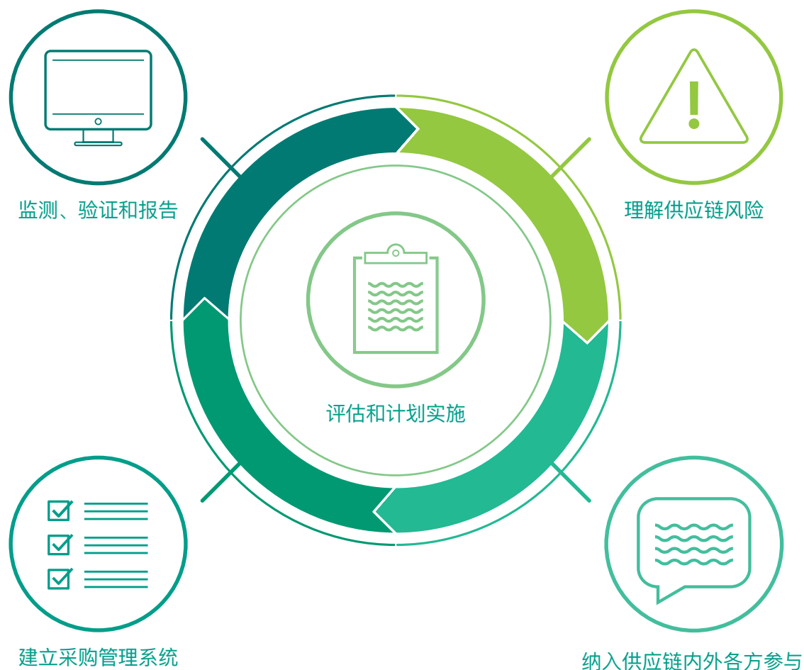
图1：负责任大豆采购的五要素方法