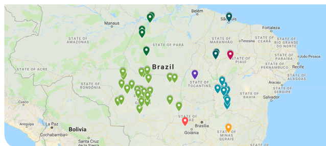
巴西大豆计划地图（右图）完整版计划清单请查阅大豆工具包简报03。

该计划在州级地方行政区层面实施（包括马托格罗索州、南马托格罗索州、米纳斯吉拉斯州、戈亚斯州和巴伊亚州等地），并开放给其它企业参与。