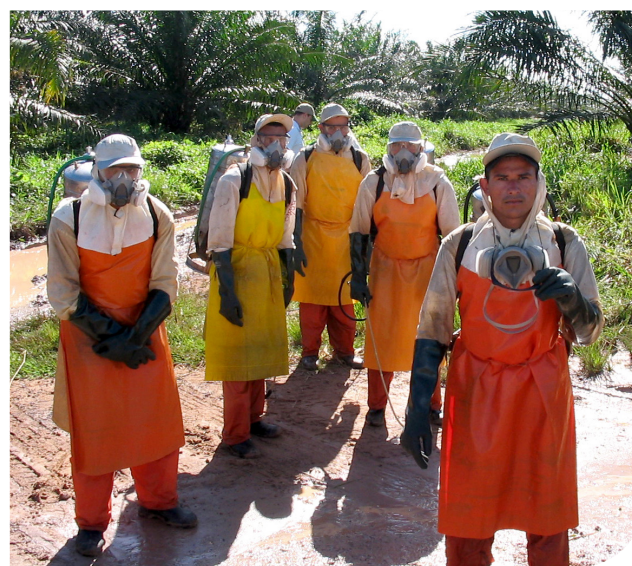
劳工健康和安​​全通常都包含在负责任采购承诺当中